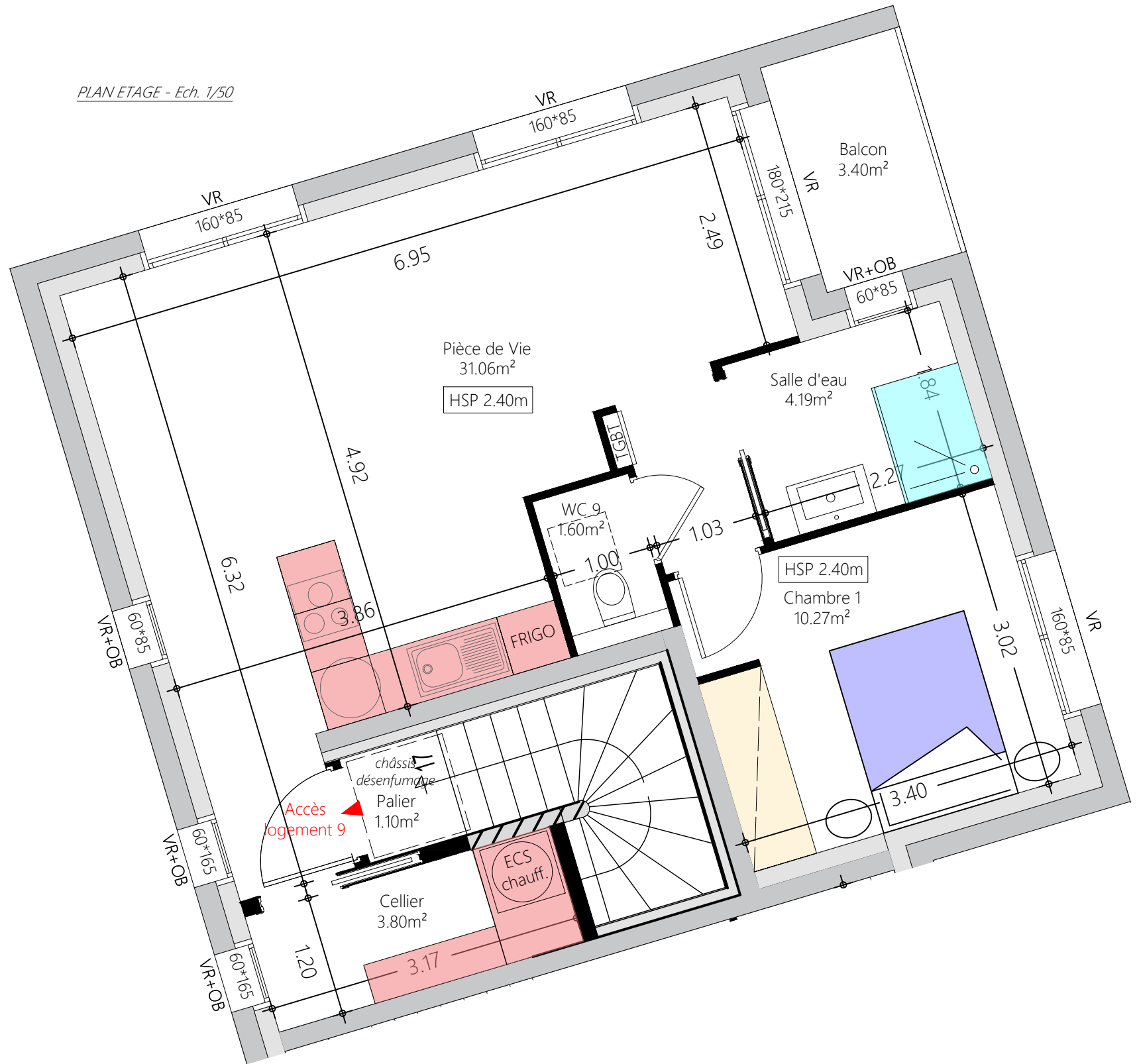
PLAN ETAGE - Ech. 1/50